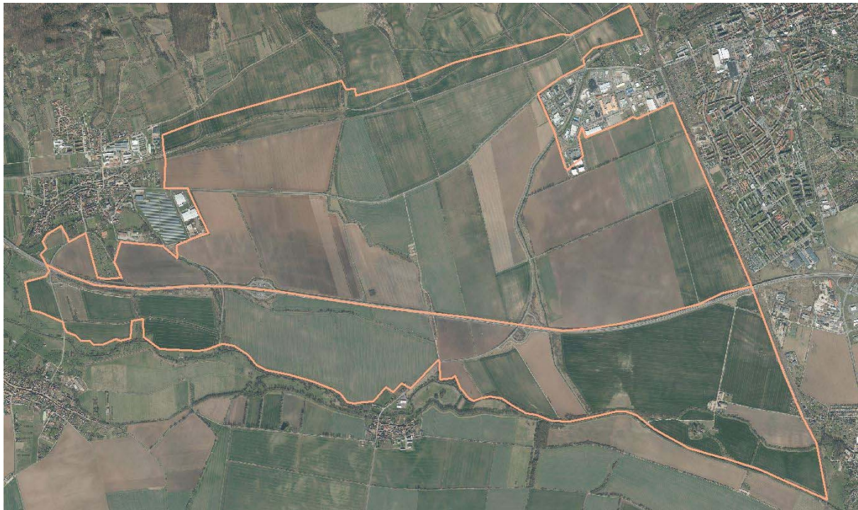
Abb. : Überschlägige Grenze des lokalen Lebensraums des Feldhamsterbestandes westlich von Sangerhausen

Innerhalb des Lebensraums der betroffenen Lokalpopulation besteht eine erhebliche Ungleichverteilung von Lebensraumbedingungen, die sich in unterschiedlichen Bodenverhältnissen manifestiert (vgl. STEININGER 2012) und auch anhand der Verteilung der Feldhamsterbaue, ergo der Siedlungsdichte, augenscheinlich wird.